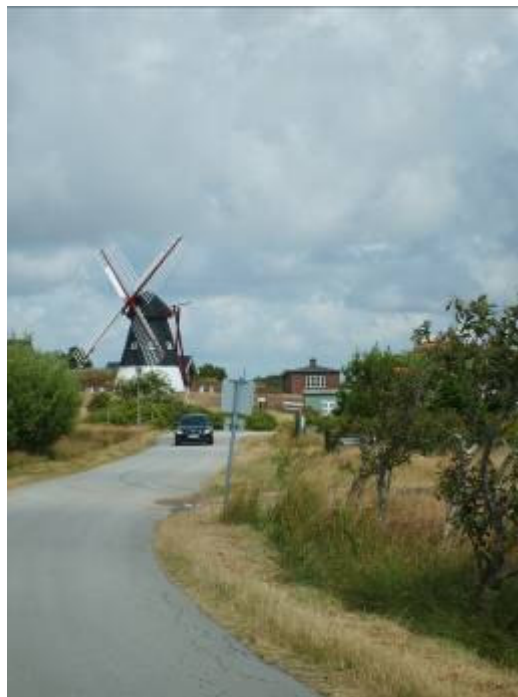
Den ældste hollandske mølle i Jylland, står nyrestaureret på Mandø.

Projektet blev afsluttet med endnu et møde den 3. april 2010. Her kunne interesserede tilmelde sig forskellige arbejdsgrupper, som arbejder videre med de mange idéer på Mandø.