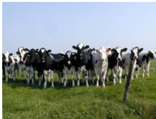
Mandø-bøffer står i kø!

Sortimentet i Ø-Butikken kunne suppleres med fødevarerprodukter fra andre danske småøer.