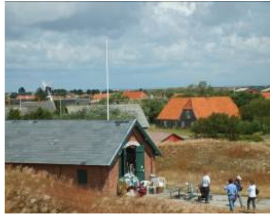
Redningsstationen på Mandø.

Der bør udvikles og tilbydes forskellige pakke tilbud til turisterne af flere dages varighed eller weekends – med overnatning og bespisning. Pakkerne kan have forskellige temaer: "Østersweekend", "Fugle på Mandø", "Natur og Kultur i Vadehavet," "Gourmet-weekend med mad fra Mandø" osv. Pakketilbuddene udvikles i et samarbejde mellem flere turistaktører på øen. Pakketilbud kan også udvikles i samarbejde med landsdækkende organisationer, f.eks. Dansk Cyklistforbund: "På cykel til Mandø." Initiativtager: Turistaktørerne på Mandø. Finansiering: Privat og turistfremmemidler.