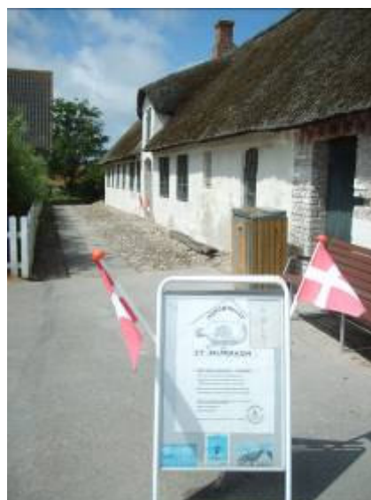
Mandø-Huset, øens lille, men spændende museum.

Lam fra Mandø sælges som marsklam. Øen bør markedsføre sine egne lam: Mandø-Lam. Kødet kan sælges fra øens egen butik eller via en internetside. Direkte salg til kunderne giver højere dækningsbidrag og dermed en større rentabilitet i produktionen – for et landbrug, som er hårdt presset på afsætningspriserne. Initiativtagere: Privat. Finansiering: Privat.