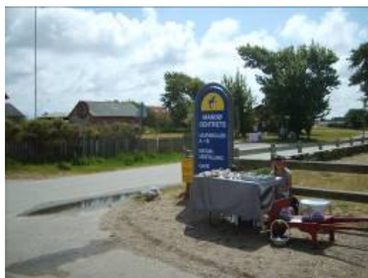
Børnene på øen har forstået budskabet, og har skabt deres egne hjemmearbejdspladser på øen.

Da Mandø Beboerforening ansøgte om støtte til at udarbejde handlingsplanen, var hovedtemaet hjemmearbejdspladser: Muligheden for at fastboende, nuværende eller tilflyttende, kan arbejde hjemmefra via internettet.