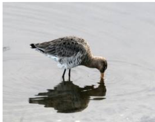
Vadehavet og Mandø er et af de vigtigste raste- og fødeområder for Europas vade-fugle.

Omkring trafikforholdene er der yderligere stillet forslag om, at Låningsvejen forhøjes, således at tidsrummet for adgang til øen udvides i forhold til højvandet.