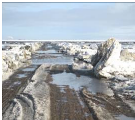
Isvinter på Låningsvejen.

Det vil give mulighed for at øens turistbærende erhverv - i et samarbejde - kan tilbyde pakkearrangementer med deltagelse af en lokal guide. Endvidere vil lejrskolerne på Mandø-Centret kunne få et væsentligt kvalitetsløft, hvis man også kan tilbyde en faglig, kvalificeret natur- og kulturundervisning til skoleklasser.