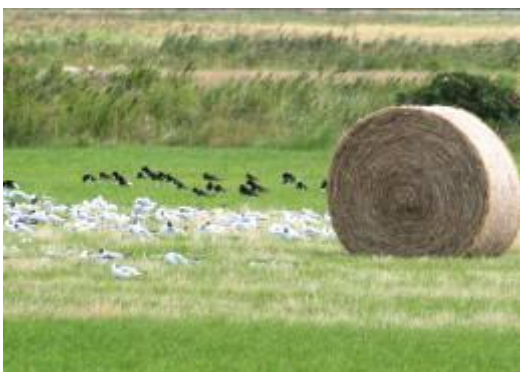
Der er fugle overalt på Mandø.