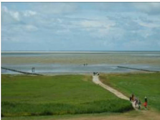
Mandø mod Vesterhavet.

Projekter, som kan og bør igangsættes på længere sigt beskrives på side 19.