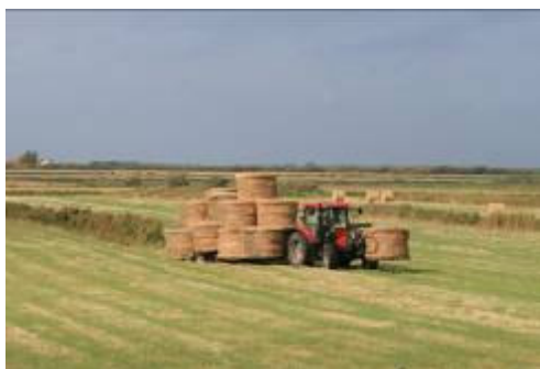
Høhøsten bringes i hus ....

Dyreholdet på øen er særdeles vigtigt. Hvis øen og digerne ikke afgræsses, vil øen meget hurtigt springe i pil og krat.