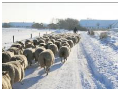
- og så er det hjem til høet og en lun stald.

I dag er forbrugerne villige til at betale ekstra for kvalitetsprodukter og den gode historie. Mandø har både