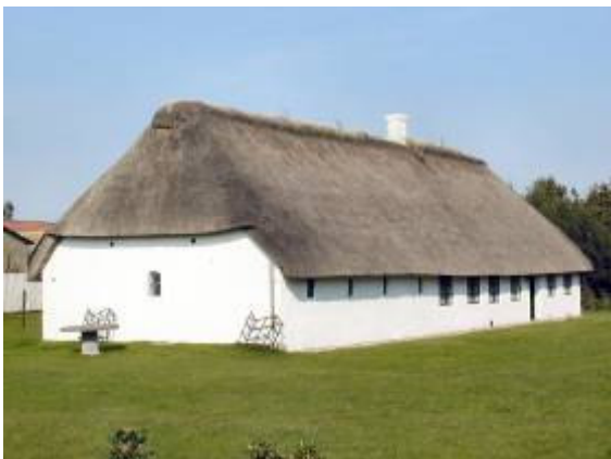
Mandø har sin egen bygningskultur – en af de gamle gårde med stald i den ene ende af bygningen.

Flere og flere mennesker handler i dag over internettet. Det er oplagt, at bruge internettet i den kundskabende kontakt gennem en fælles hjemmeside om Mandø-produkter, hvor det også er muligt at bestille og betale produkterne direkte og online.