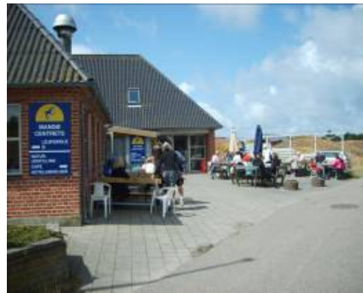
Mandø-Centret er omdrejningspunktet for de mange endagsturister, som besøger øen.

Skal flerdagsturismen udbygges – og skal turisterne komme mere end én gang - er forudsætningen, at der etableres nogle flere aktivitetstilbud på øen.