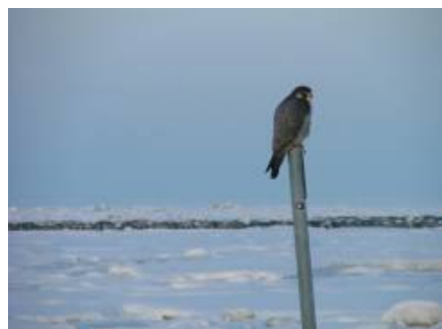
I vinterkulden har vandrefalken fundet den eneste pæl ved Låningsvejen, som sin hvileplads ved Mandø.

Ca. 15 øboere og fritidsboere tilkendegav, at de tager udfordringen op og indgår i en eller flere af de arbejdsgrupper, som fortsætter arbejdet, koordineret af Mandø Fællesråd. Inden sommerferien 2010 mødes arbejdsgrupperne til en workshop, hvor der bl.a. sættes fokus på forskellige muligheder for at finansiere de mange, gode idéer til fremtidig udvikling på Mandø.