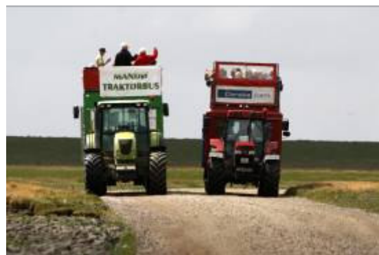
Turisterne er på vej til øen med Traktorbusserne.