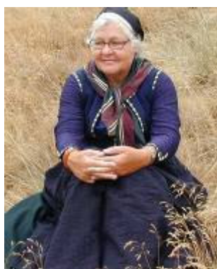
Ved festlige lejligheder bruger kvinderne på øen fortsat den smukke Mandø-dragt.

En vis form for koordinering mellem transportørerne og kørslen til Mandø ville være hensigtsmæssig, f.eks. i forhold til koordinering af aftenture til Mandø og afgang, som kunne sikre turisterne et længere ophold på øen.