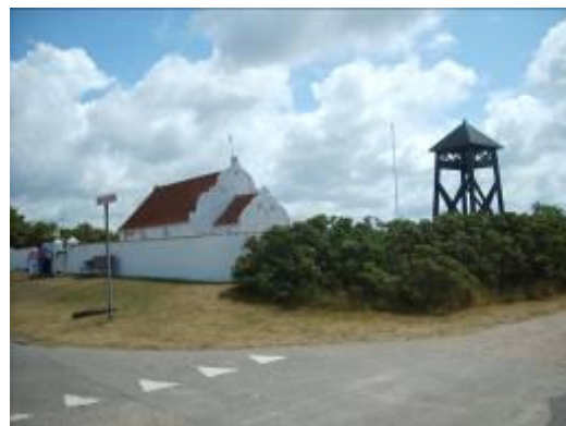
Mandø Kirke med klokkestabelen.

Parkeringsforholdene for de store, ca. 12-14 meter lange traktortræk, kan virke kaotisk. Den ene bustransportør holder ved Brugsen, den anden ved kroen.