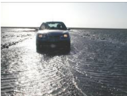
Ad Låningsvejen – lige før det bliver for sent.